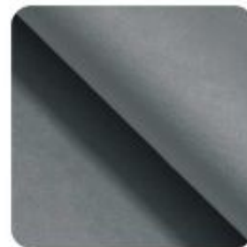
Paris light blue