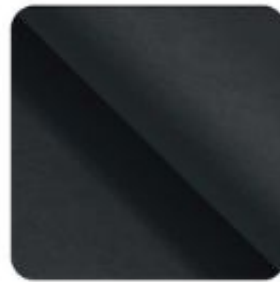
Paris dark blue