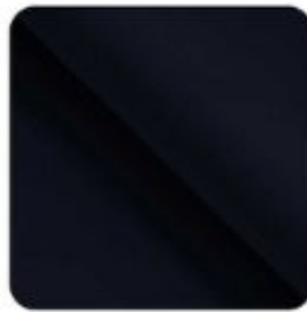
Paris deep blue