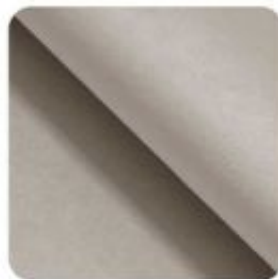
Paris light cream