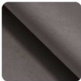
Paris light gray